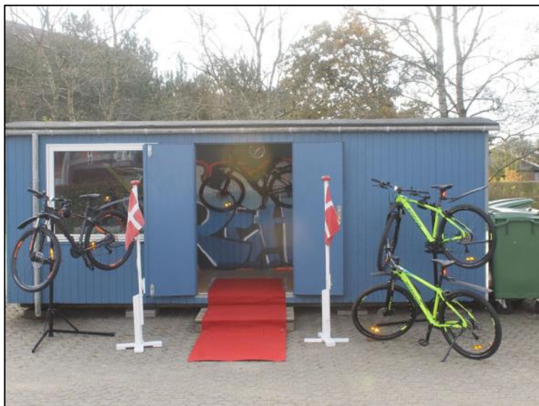
Cykelværkstedet med BIFOS' MTB cykler.