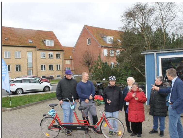
Tandem. Gave fra Springbrættet.