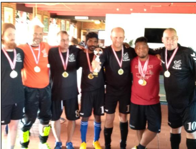
Mob Din Krop Frederikshavn guldmedalje-vindere i fodbold.