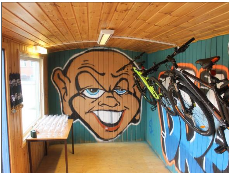
Graffiti af Søren Philbert.