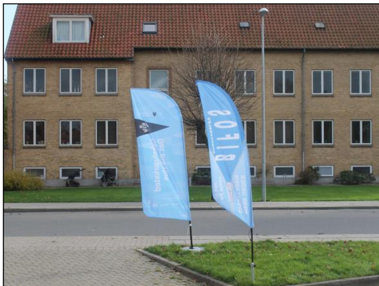
Flag for cykelværkstedet og BIFOS.