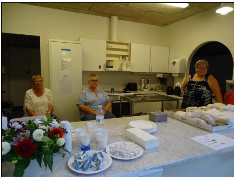
Venneforeningen sælger sandwich.