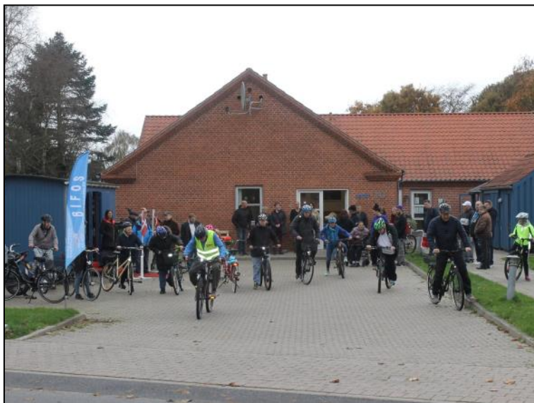
Klar til cykeltur.