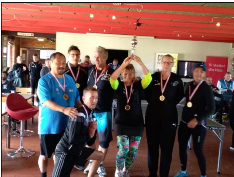
IFS Hjørring guldmedalje vindere i volleyball.