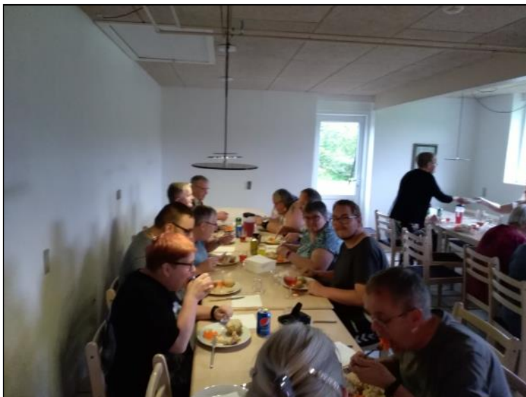
Spisning i køkkenet.