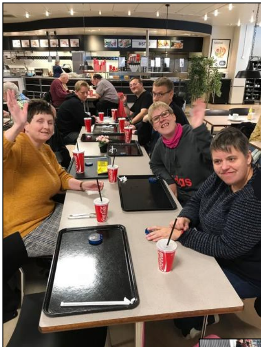
Frokost i Føtex.