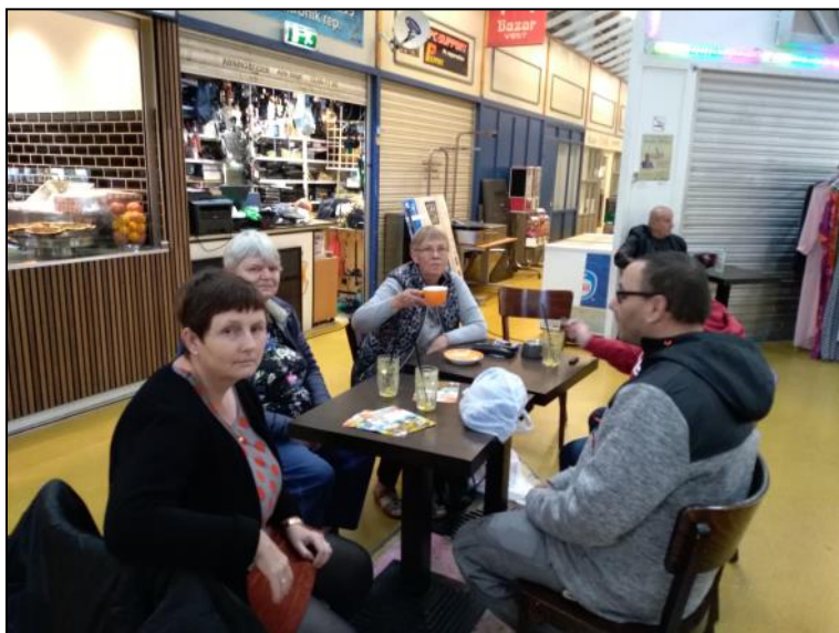
Der drikkes kaffe og friskpresset juice.