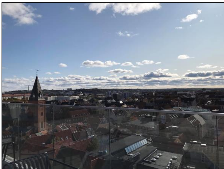
Udsigt over Ålborg.