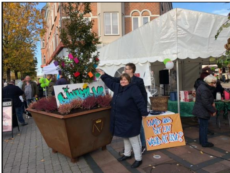
Træ med sedler om ting, der gør livet værd at leve.