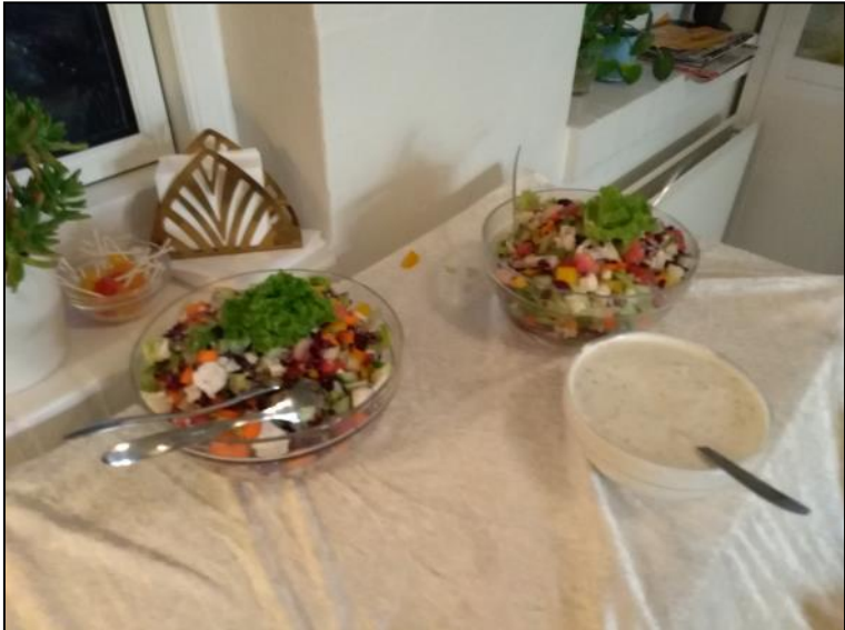
Salat med dressing.